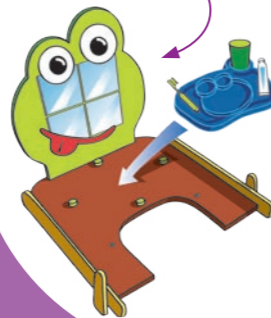
Le jeu des 7 familles de Clément